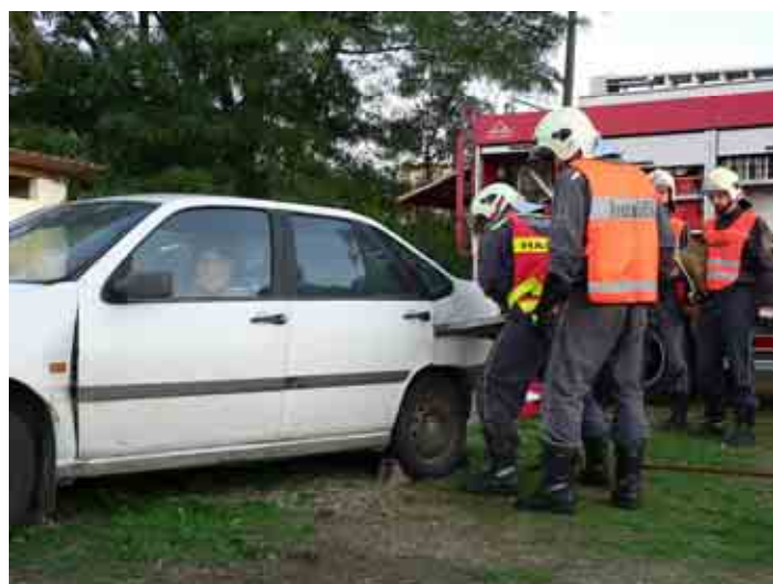
Před zahájením tradičního Bu-bu-lesa přiletěl na plochu hřiště vrtulník, proběhla i ukázka práce hasičů.