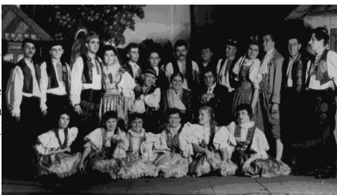
Soubor V. Vančury: Slovácká princezka – opereta