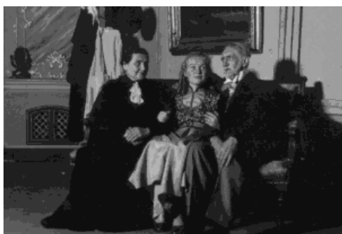
Nejstarší herci: Když ptáčka lapají – komedie