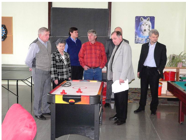
↑ 17.4.08 se konalo setkání starostů a starostek Mikroregionu Radbuza v DDM Vstíř. O přestávce si někteří prohlédli prostory určené dětem