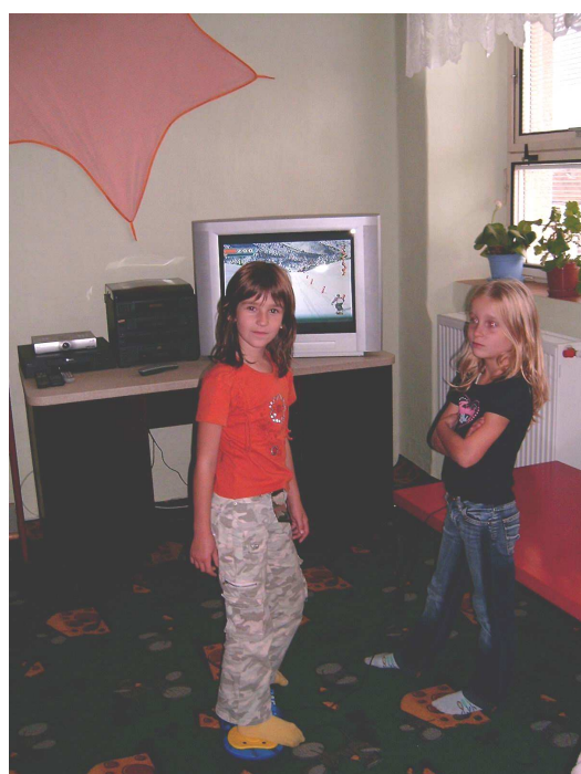
Mezi nové hry patří i snowboarder propojený s televizí

S sebou: láhev, nůžky, ručník, přezůvky, svačinu, pití