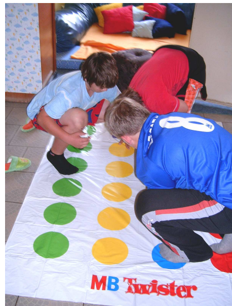
V klubu mají děti připravenou činnost každý den

Přijďte si vyzkoušet svoji ohebnost a výdrž na podložce určené pro hru twister. V pátek 5.10.07 v 16.00 hod. začínáme v tělocvičně DDM Vstíř. Na sebe pohodlné oblečení (rifle vhodné nejsou), na nohy čistou sportovní obuv.