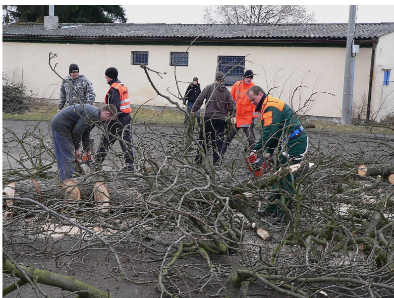
Jeden z dalších zásahů místních hasičů. Pokácení starého kaštanu na Bayerce