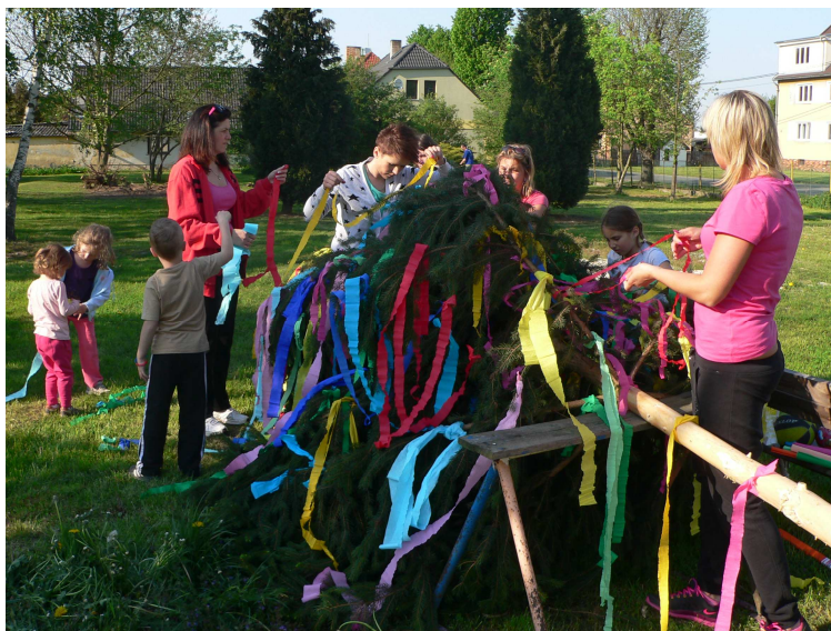
... stavění májky ...