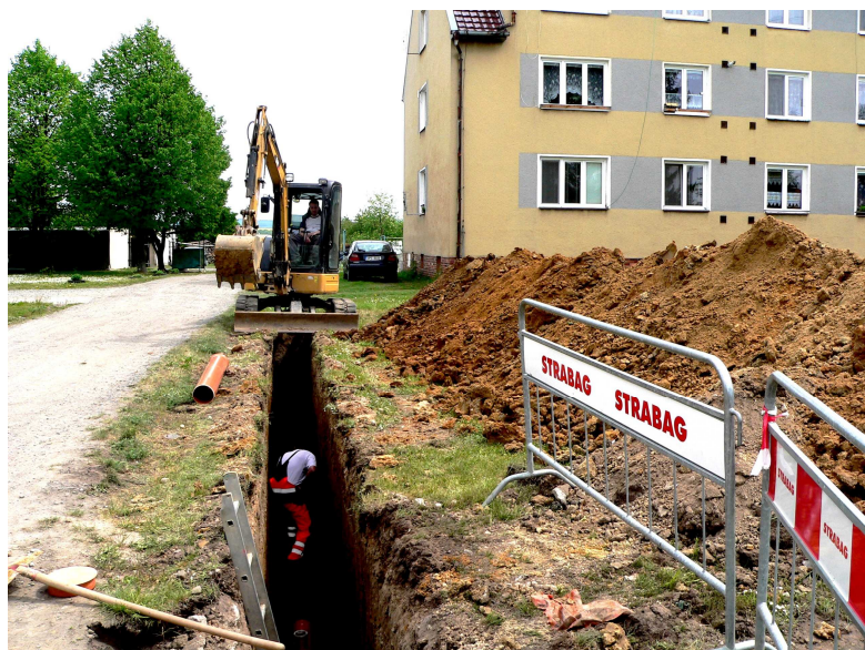
... budování přípojek ...