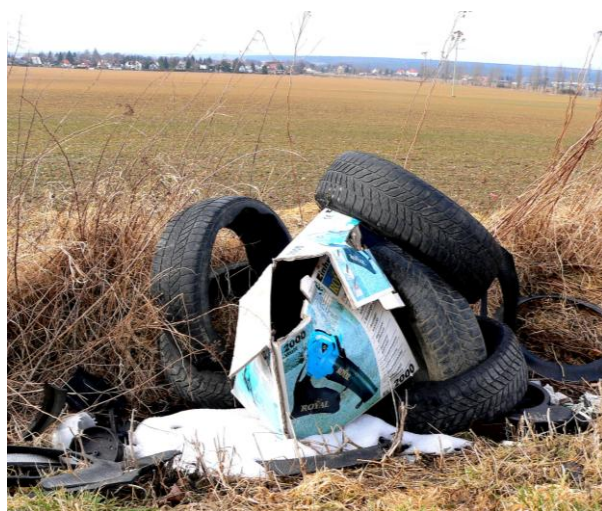
Černá skládka se nám bohužel začala tvořit jinde. M. Beštová

Jak sami vidíte, ani zbytky automobilů příliš parády nenadělají.