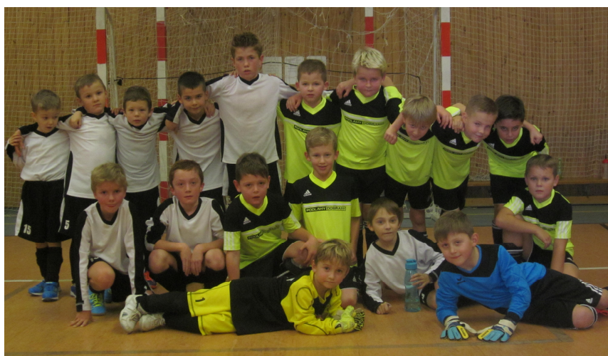
Naši nejmenší fotbalisté na turnaji ve Štěnovicích

Poklidné prožití adventního času, krásné Vánoce a co nejlepší start do roku 2017 přejí všem občanům a přátelům Vstiše zastupitelé.