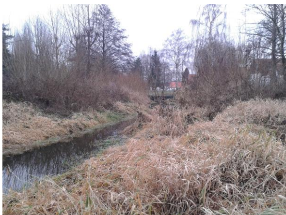
Potok před úpravou