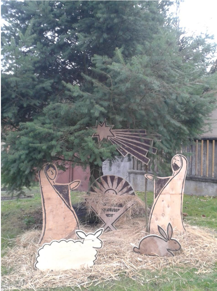
Betlém u Kapounů.