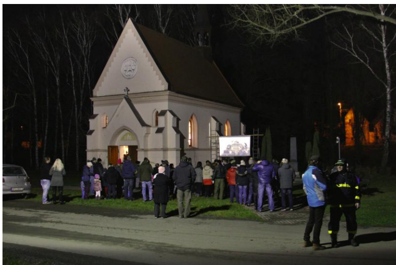
Advent ve vstišské kapli...